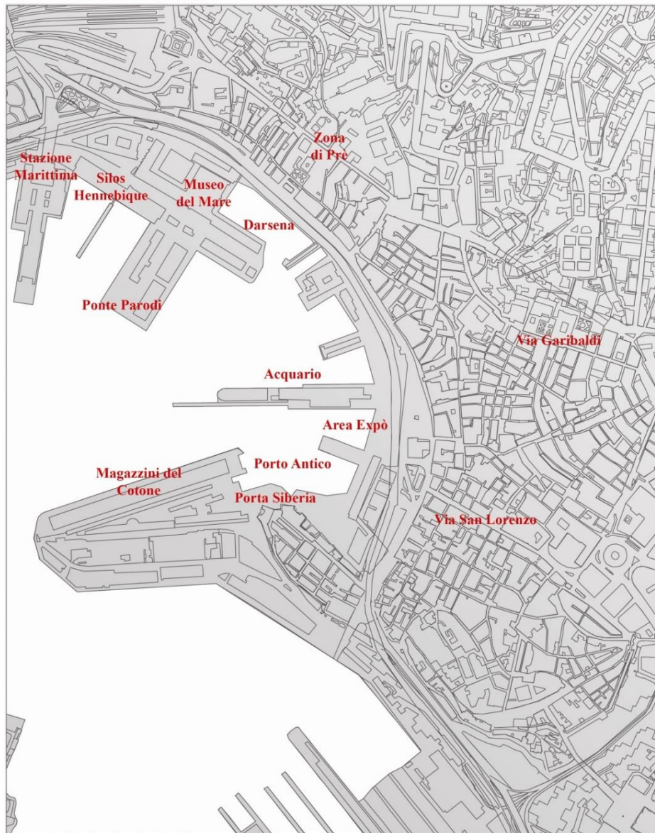
Fig. 2: planimetría de la zona del Puerto Antiguo.