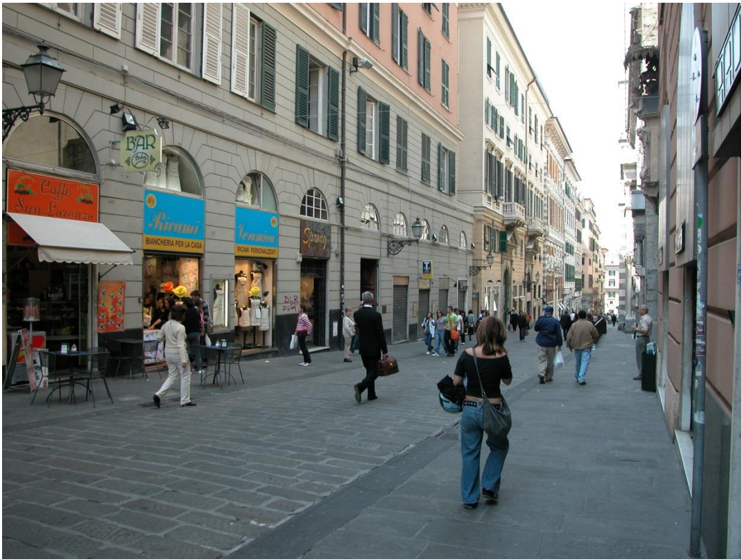
Fig. 3: vía San Lorenzo, una de las calles principales del centro histórico.