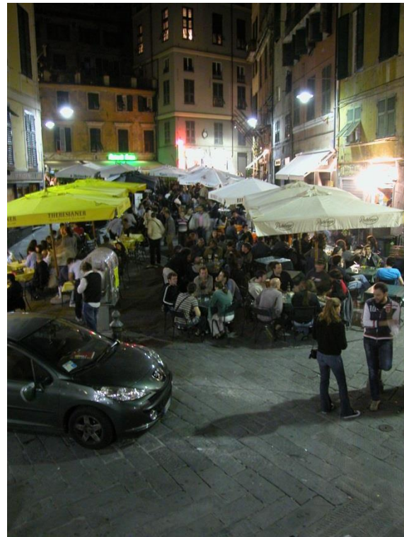
Fig. 4 y 5: a la izquierda la hora del almuerzo y a la derecha la movida por la noche en Plaza delle Erbe.